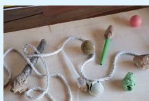
武友義樹さんが振っていた紐

会場:NO-MA(滋賀県 近江八幡市永原町16) 開催時間:14:30~17:00 ※ツアー参加者は13:30~